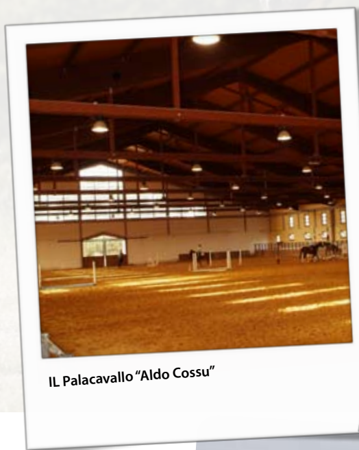
IL Palacavallo "Aldo Cossu"